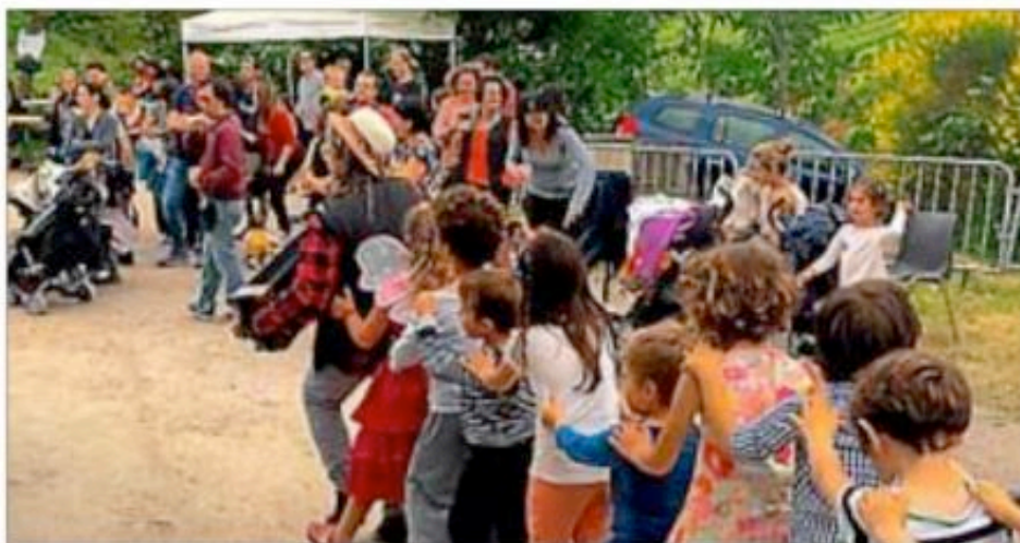
■ Le baléti de l'association Fanfan le Lune.

► Correspondant Midi Libre : 06 88 85 98 04.